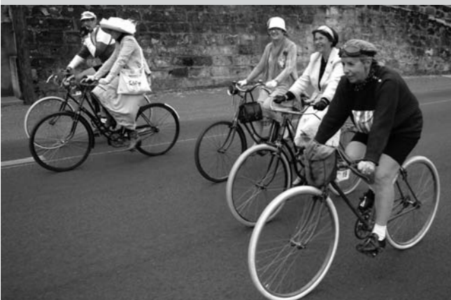
Anjou-Vélo-Vintage à Saumur