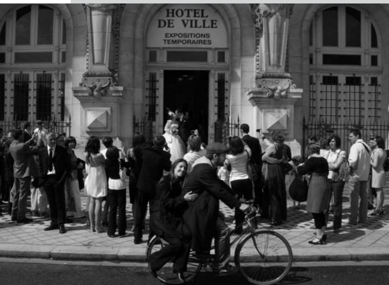
Hôtel de Ville de Tours